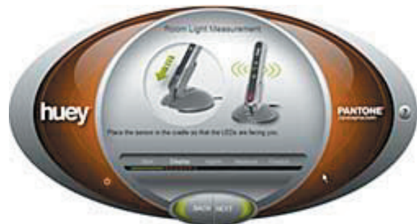
Heldere instructies bij elke stap