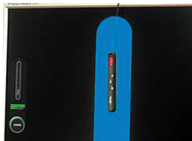
De software loopt door een selectie van kleuren