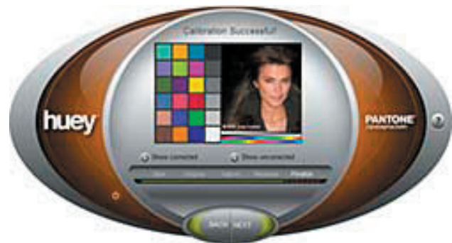
Selecteer de kleur waarmee u wilt werken