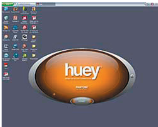
De huey interface

Als we de snelstarthandleiding volgens de letter volgen, dan reinigen we eerst ons beeldscherm met de Klear doekjes. Het installeren van de software kostte ons 19 seconden op ons systeem en vroeg om een herstart na installatie. Zodra de computer is herstart, verbinden we de huey met onze computer d.m.v. de USB kabel. Plaats de huey op uw bureau met zijn voorkant naar u toe en dan leest de huey het omgevingslicht bij u, wanneer hij daarmee klaar is, wordt u verzocht de huey tegen uw beeldscherm te plaatsen.