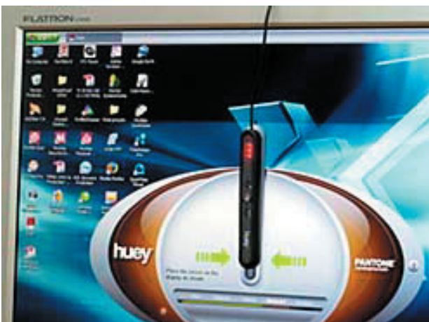
Bevestigd tegen een LCD of CRT scherm