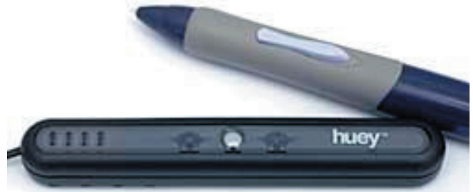
Het is een hele kleine unit!

Het eerste wat opvalt, is dat de huey zo klein is, ongeveer zo groot als een Wacom pen! De huey heeft 8 kleine zuignappen die hem op zijn plaats houden tegen het beeldscherm aan en kan zowel gebruikt worden voor een CRT als LCD schermen (en laptops). We waren wat voorzichtig met het plaatsen tegen het delicate oppervlak van een LCD scherm. De zuignapjes moeten wat nat worden gemaakt. Gebruik daar liever een vochtige doek voor dan er aan te likken... Een beetje aandrukken is gewenst om de huey tegen het LCD scherm te laten kleven, maar niet zoveel dat er schade ontstaat! Voor een CRT scherm hoeft u niet bang te zijn, gewoon het ding erop plakken!