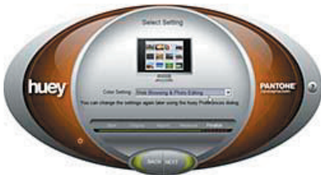
Bekijk vóór en na resultaten