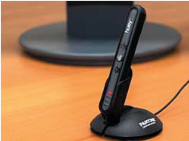
Het lijkt wel wat op een microfoon